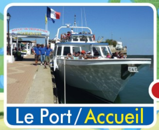
Le Port / Accueil