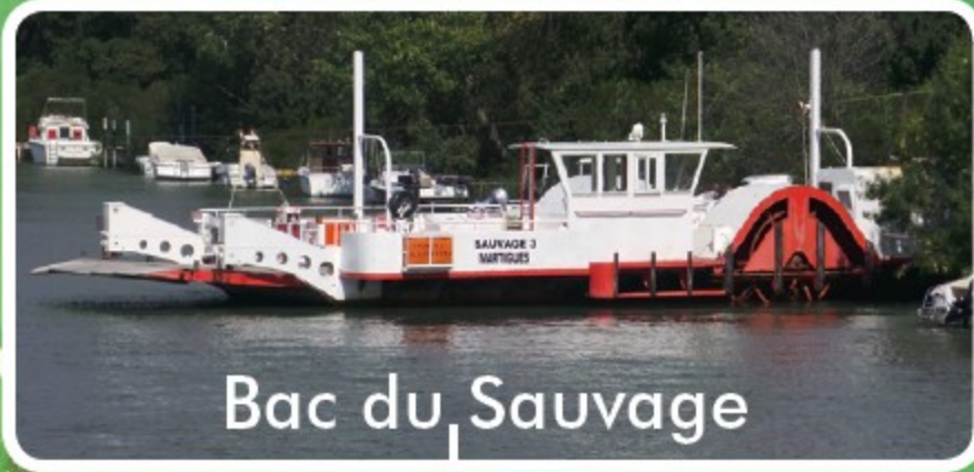
Bac du Sauvage