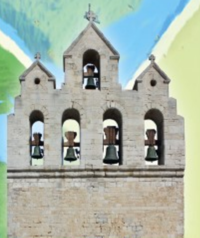
Les Saintes Maries