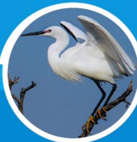
Le paradis des oiseaux de Camargue