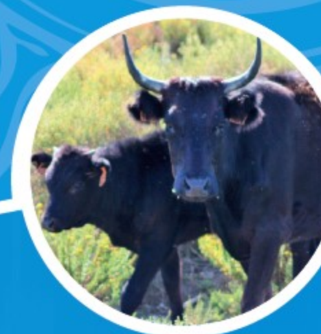
Taureaux de Camargue